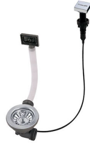
Desagüe automático LIRA 8407 102