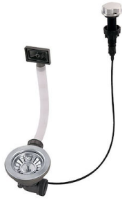
Desagüe automático 8407 000