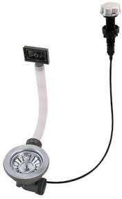
Desagüe automático 8407 100