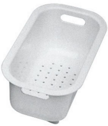
escurre pasta blanco 8151 100